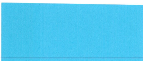
Ľubomír Mišík manažér DC Beckov